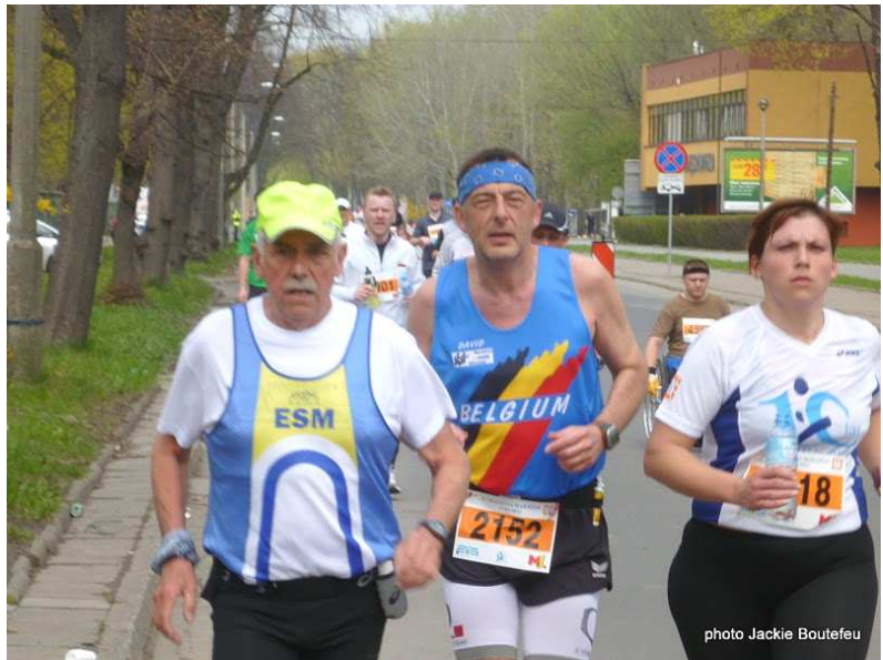
Marathon de Cracovie, le 15 avril