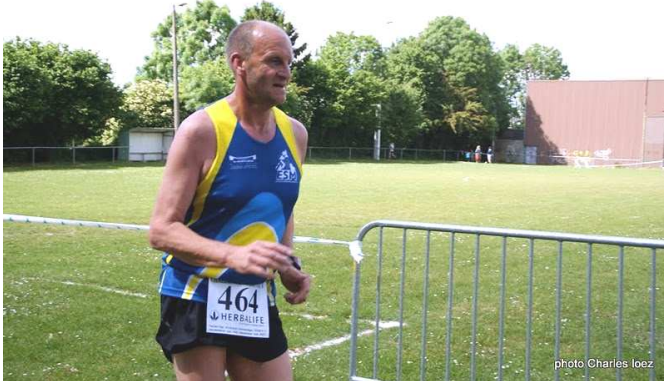
Piéton, le 14 mai