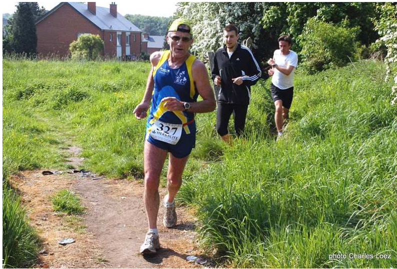
Ihuin, le 30 avril