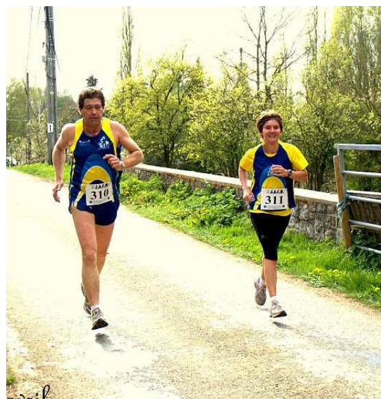
Chimay, le 16 avril